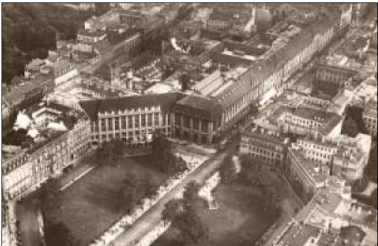
▲ Das große Warenhaus Wertheim am Leipziger Platz um 1927. Auf rund 18.500 Quadratmetern Verkaufsfläche gab es hier bis zum 2. Weltkrieg alles. Es wurde von 1897 bis 1904 nach dem Entwurf des Architekten Alfred Messel erbaut. Die Schaufensterfront des Kaufhauses war 330 Meter lang.

kommend am unterirdischen Regional-Bahnhof Potsdamer Platz zum Shoppen aussteigen, werden auch sie das große Kaufhaus vermissen. Sie werden mit der