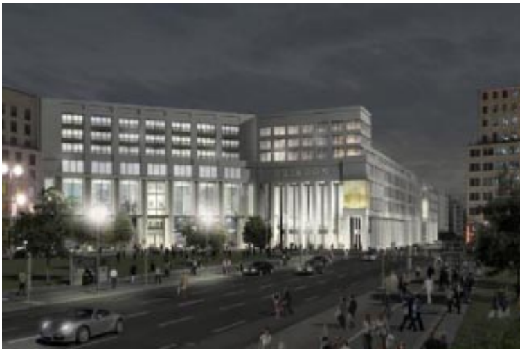
▲ Kleihues-Plan für die Bebauung des Wertheim-Areals. Mit den Säulen am Leipziger Platz orientiert sich der Architekt am alten Wertheim-Warenhaus von 1904. Längs der Leipziger Straße sollen Arkaden entstehen.

BERLIN – 31.3.2009 (khd/tp). Die gesamte Bebauung des Wertheim-Areals am Leipziger Platz ist nun wieder ins Stocken gekommen – und vielleicht sogar ins Wanken [10]. Der Investor Orco hat nicht genug Geld, und die Banken wollen in der Finanzkrise kaum noch Kredite für solche