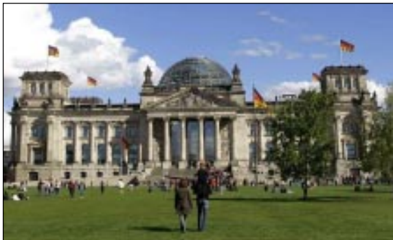
▲ Der Reichstag in Berlins Mitte ist der Sitz des Deutschen Bundestags – des deutschen Parlaments. [Ergebnisse aller Bundestags-Wahlen seit 1949]

Es gibt sie zuhauf. An einige weniger häufig diskutierte Saumseligkeiten und Ärgernisse soll erinnert werden, die in den letzten 25 Jahren weder die Parteien noch die Regierungen im Sinne der Bürger und Volkswirtschaft angepackt und neu geregelt haben.